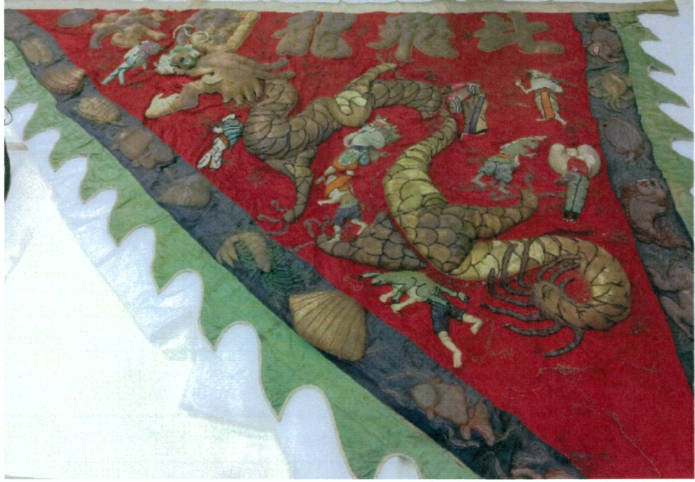
北港飛龍團大龍旗 F1 正面