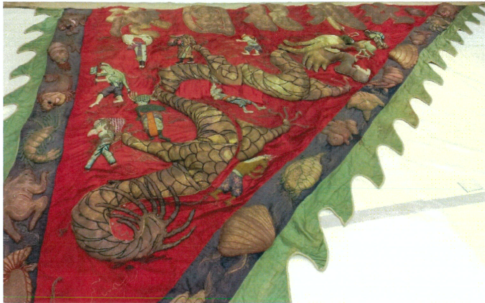
北港飛龍團大龍旗 F2 正面