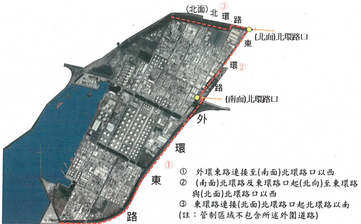
附圖一：經濟部工業局雲林離島式基礎工業區