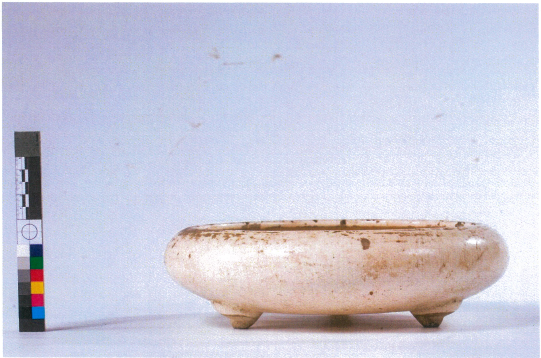
北港義民廟東溪窯米白釉三足爐