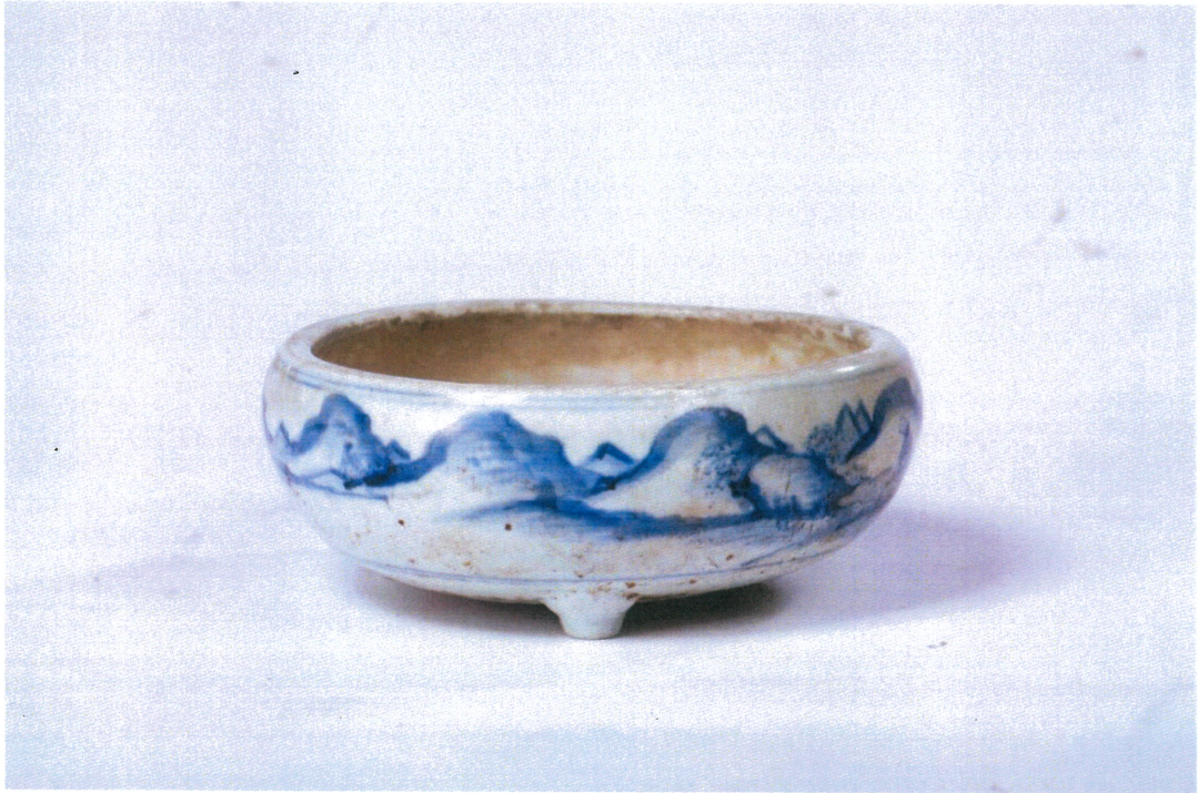
北港義民廟德化窯青花山水人物三足爐