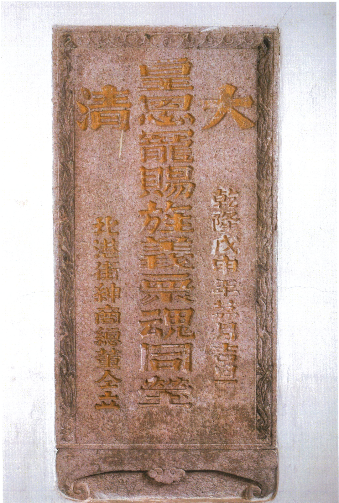
北港義民廟大清皇恩寵賜旌義眾魂同瑩碑