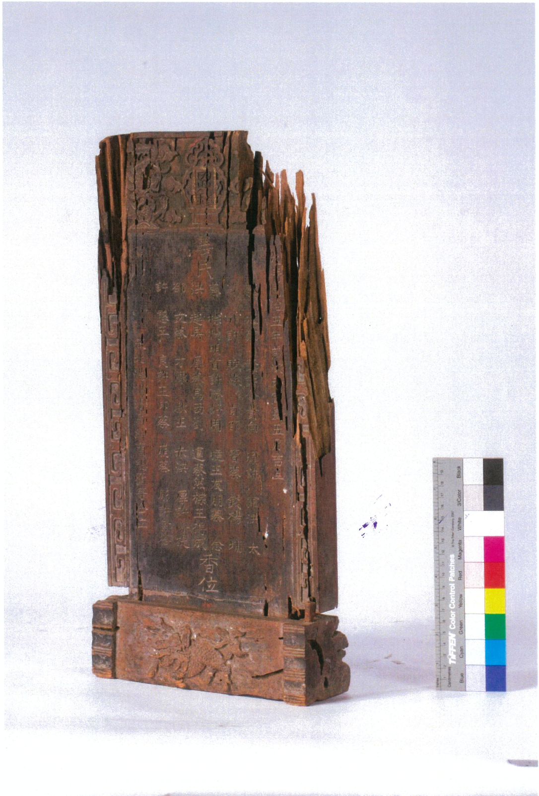
北港義民廟同治五年款義民香位牌