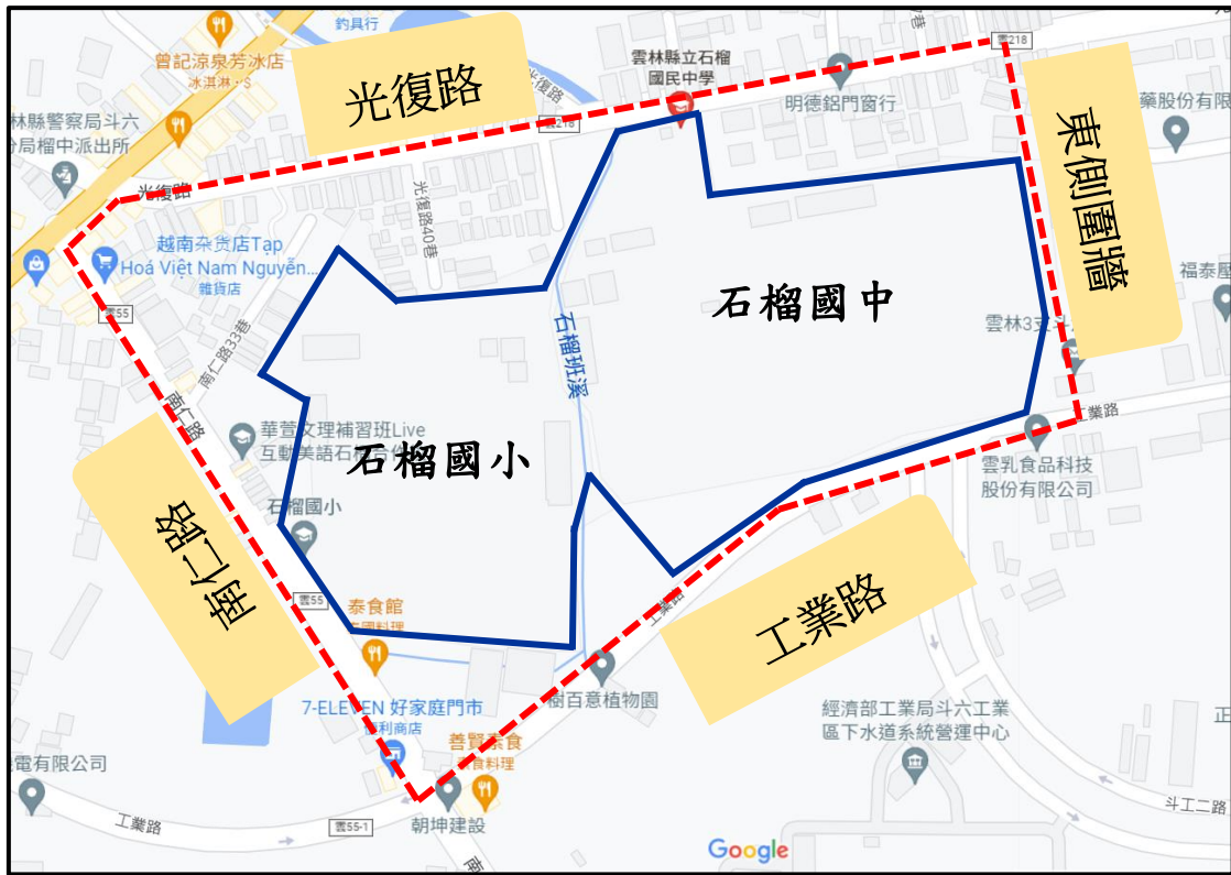
附圖、石榴國中、小空氣品質維護區管制區域範圍(紅虛線方框內)